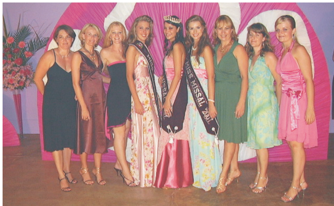
Equipe do Departamento de Cultura, responsável pelo desfile, com as misses