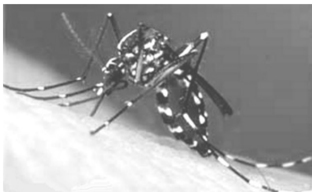
Mosquito Aedes aegypti

outros depósitos impedindo a entrada do mosquito;