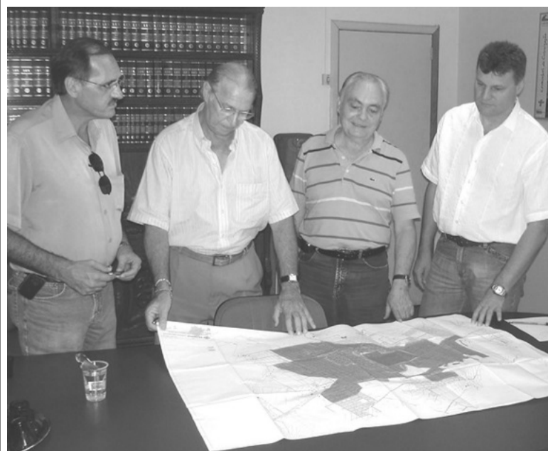
Apresentação do projeto de ampliação da rede coletora de esgoto