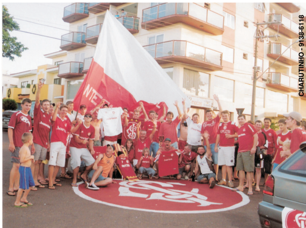
CHARUTINHO - 9138-6118