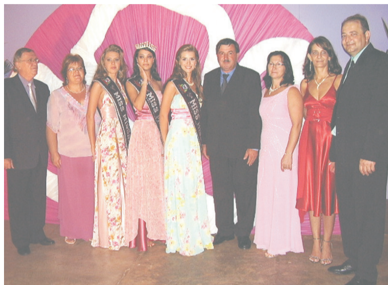
Autoridades do município com as misses